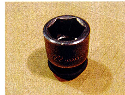
① 対辺 22mm 「六角ソケットレンチ」を使用する