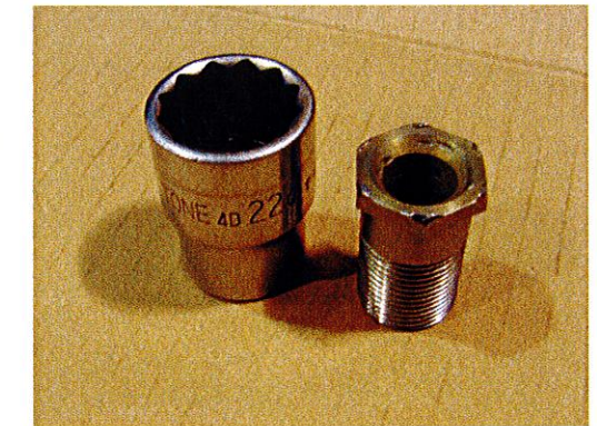
②対辺 22mm 「12角ソケットレンチ」と 「六角がナメてしまったスイベルジョイントシャフト」

対辺 22mm 「12 角ソケットレンチ」を使用すると、スイベルジョイントシャフトがナメてしまい「組立て不能・分解不能」となってしまいます。 必ず対辺 22mm 「六角ソケットレンチ」を御使用下さい。